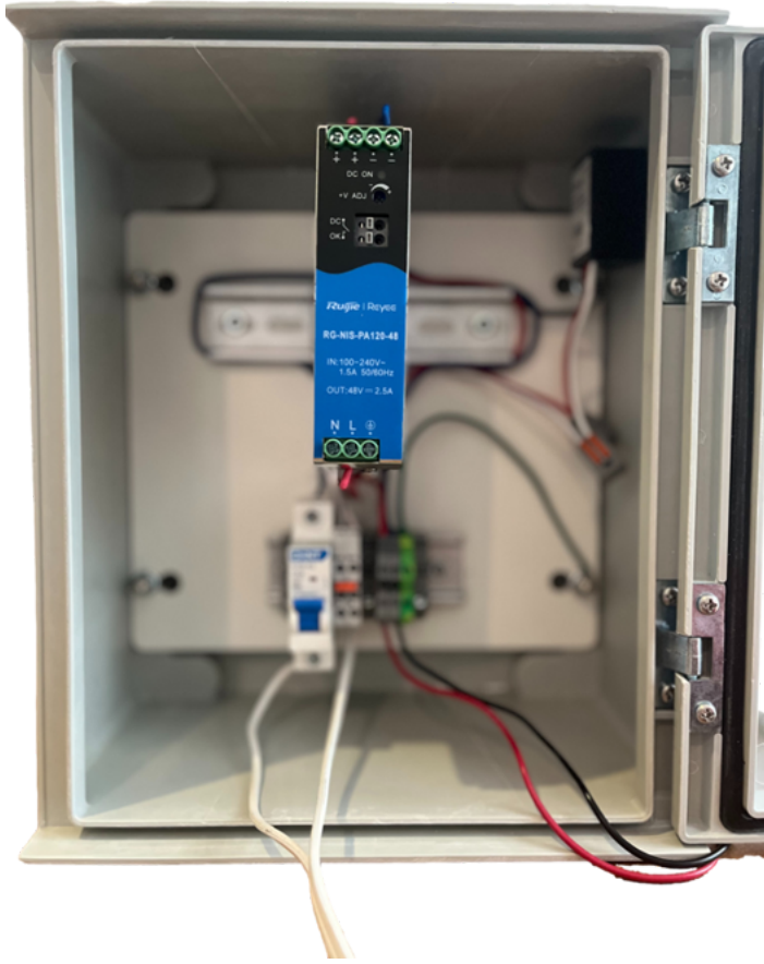
FOTO-CONTROLADOR CON FUENTE DE PODER AC A DC Y FOTOCELDA