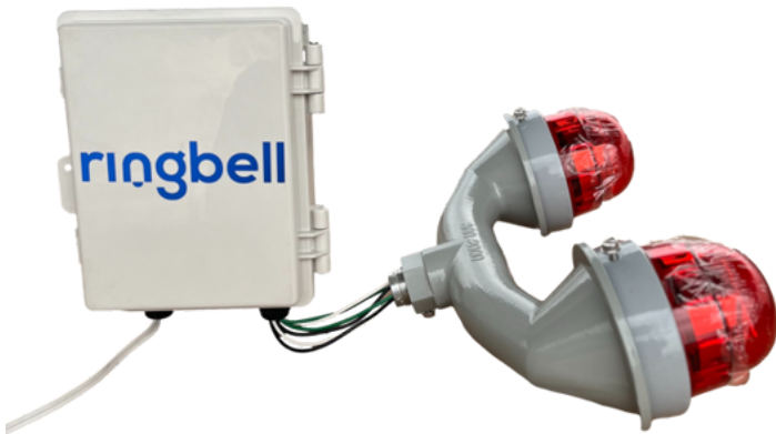
FOTO-CONTROLADOR CON DESTELLADOR PARA LUCES DE OBSTRUCCIÓN SENCILLAS O DOBLES

Controlador con fotocelda para luces sencillas o dobles tipo L-810, compatible hasta con 20 luces. Incluye herraje de fijación universal tipo abrazadera sin fin. Enciende automáticamente las luces en el crepúsculo y las apaga al amanecer.